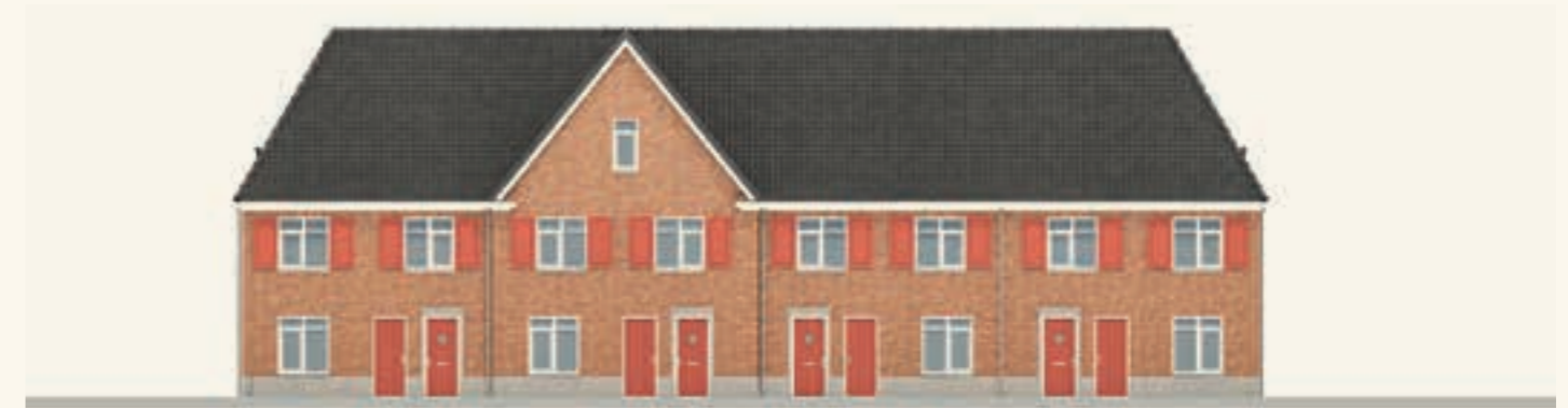
KAVEL 80 T/M 83