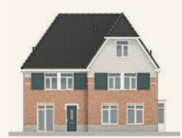
KAVEL 3 & 4