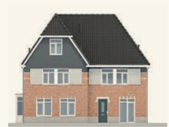
KAVEL 86 & 87