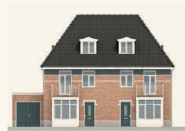
KAVEL 84 & 85