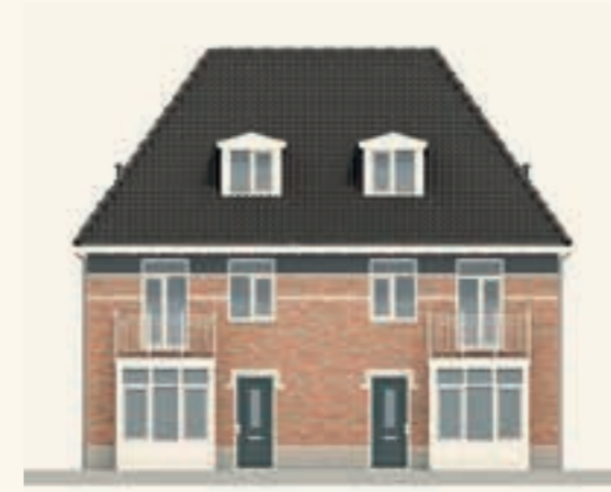
KAVEL 1 & 2