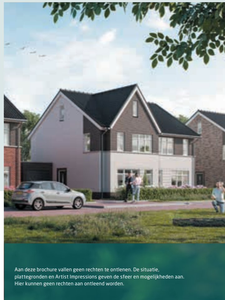
Aan deze brochure vallen geen rechten te ontleen. De situatie, plattegronden en Artist Impressions geven de sfeer en mogelijkheden aan. Hier kunnen geen rechten aan ontleend worden.

Hoeveel en welke funderingswerkzaamheden nodig zijn, is het risico van de koper. De grond die vrijkomt, moet je op eigen terrein opslaan. Als er na het aanvullen van de kavel grond overblijft, moet je zelf voor de afvoer van deze grond zorgen. Er is hier geen opslagterrein voor.