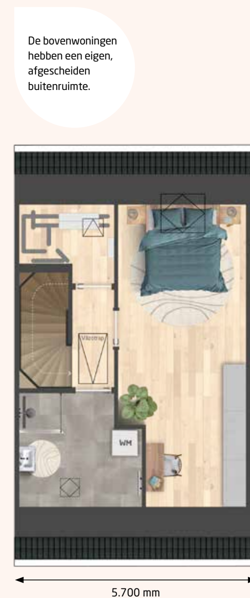
BOVENWONING - VERDIEPING KAVEL 168 | KAVEL 166 EN 164 GESPIEGELD

De bovenwoningen hebben een eigen, afgescheiden buitenruimte.