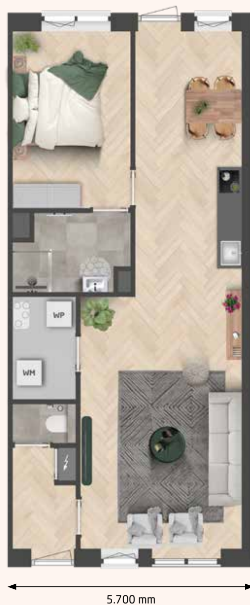
BENEDENWONING KAVEL 167 | KAVEL 165 EN 163 GESPIEGELD

Let op: Kavel 161, 162, 169 en 170 hebben een accent in de voorgevel, een andere indeling/kap aan de voorgevel en zijn 420 mm langer.