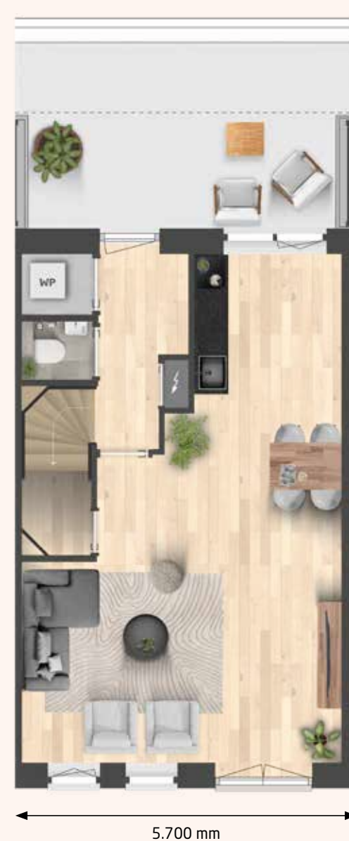
BOVENWONING - BEGANE GROND KAVEL 168 | KAVEL 166 EN 164 GESPIEGELD